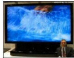
Téléviseur LDC de 2,50 m