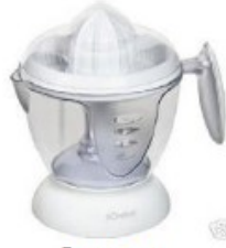
Presse agrumes Carrefour: 15€